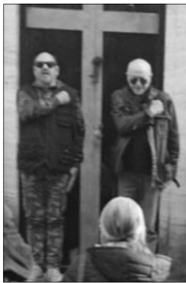
camerati italiani". www.fascinazione.info

"Abbiamo scelto - precisa Nardulli che abbiamo ascoltato telefonicamente - di onorare i nostri morti alla Cappella dei Martiri della Rivoluzione fascista perché riteniamo, a giusta ragione, che il monumento del Verano rappresenta ed è il simbolo di tutti i