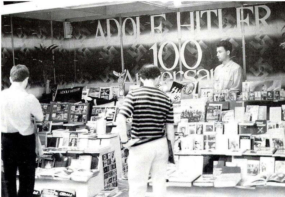
UNA MUESTRA DE LA LUCHA CULTURAL REALIZADA ABIERTAMENTE POR CEDADE. AQUÍ, UN PUESTO DE LIBROS CON MOTIVO DEL CENTENARIO DEL NACIMIENTO DE ADOLF HITLER.

política pueda llegar al pueblo de forma directa y con posibilidades de éxito. Entonces, dentro del realismo político, nuestra lucha deberá orientarse a aprovechar esa oportunidad, y nuestra labor anterior nos permitirá hacerlo sin ceder ni traicionar los valores de la Cosmovisión general del mundo.