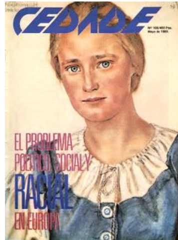
LA FAMOSA REVISTA "CEDADE", CUYA INFLUENCIA SE EXTENDIÓ EN TODA HISPANOAMÉRICA COMO UN FENÓMENO POLÍTICO INUSITADO.

Para nosotros la Revolución Nacional-Socialista no nace en 1920 con Hitler sino que ella es sólo una continuación de una lucha eterna, constante, entre los Valores elevados frente al egoísmo y la avaricia que siempre han tratado de dominar el mundo . Esta lucha permanente en los años 20 se cristaliza en lo que se llama ahora Nacional-Socialismo, pero que con otros nombres ya fue NS antes, al defender nuestra misma Cosmovisión del mundo. El Enemigo del Mundo no es sólo el actual sistema usurario ni el materialismo progresista, ellos son sólo la cristalización actual, sin duda la más extrema en su repugnancia, de la tendencia degradante, egoísta y decadente que desde siempre ha existido.